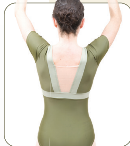
Malla Caliope combianda en lycra talles: S - M - L